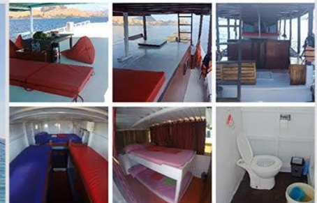
Kapal AC Standar kapasitas maks 12 Orang