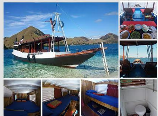
Kapal AC Standar Kapasitas Maks 8 Orang