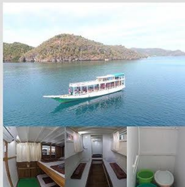
Kapal AC Standar Kapasitas Maks 8 Orang