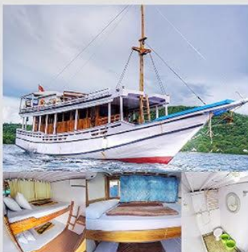
Kapal AC Standar kapasitas maks 12 Orang