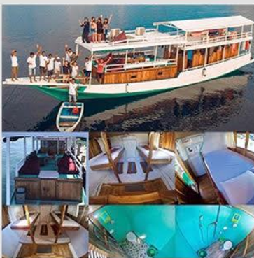
Kapal AC Standar kapasitas maks 14 Orang